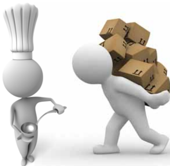
Najčešći sezonski poslovi: ugostiteljstvo i rad na građevini

Najčešći sezonski poslovi su radovi na građevini, utovar/istovar, pomoćni poslovi, berači voća na plantažama, zatim promoterke, anketari, prodavci sladoleda, konobari, kuvari, poslastičari, recepcionari, sobarice i drugi ugostiteljski poslovi.