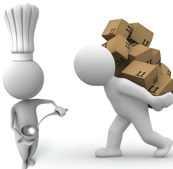
Najčešći sezonski poslovi: ugostiteljstvo i rad na građevini

Najčešći sezonski poslovi su radovi na građevini, utovar/istovar, pomoćni poslovi, berači voća na plantažama, zatim promoterke, anketari, prodavci sladoleda, konobari, kuvari, poslastičari, recepcionari, sobarice i drugi ugostiteljski poslovi.