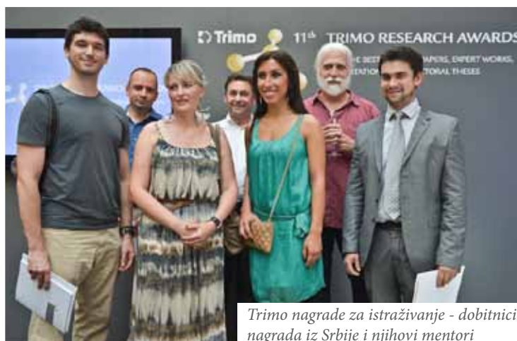
Trimo nagrade za istraživanje - dobitnici nagrada iz Srbije i njihovi mentori

Za jedanaest godina, u Trimu je dodeljeno više od 450 nagrada za istraživanje – od