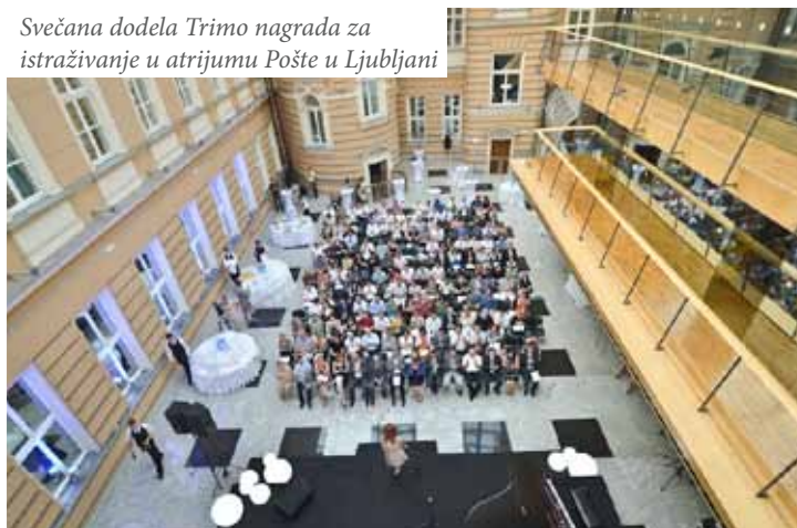
Svečana dodela Trimo nagrada za istraživanje u atrijumu Pošte u Ljubljani

Na dosadašnjim konkursima, učešće je uzelo i 250 mentora nagrađenih radova sa približno 60 fakulteta iz 12 država . Na konkurs mogu da se prijave radovi s područja arhitekture, industrijskog dizajna, građevine, mašinstva, ekonomije i razvoja poslovanja i zaposlenih.