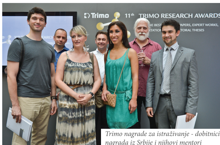
Trimo nagrade za istraživanje - dobitnici nagrada iz Srbije i njihovi mentori

Za jedanaest godina, u Trimu je dodeljeno više od 450 nagrada za istraživanje – od