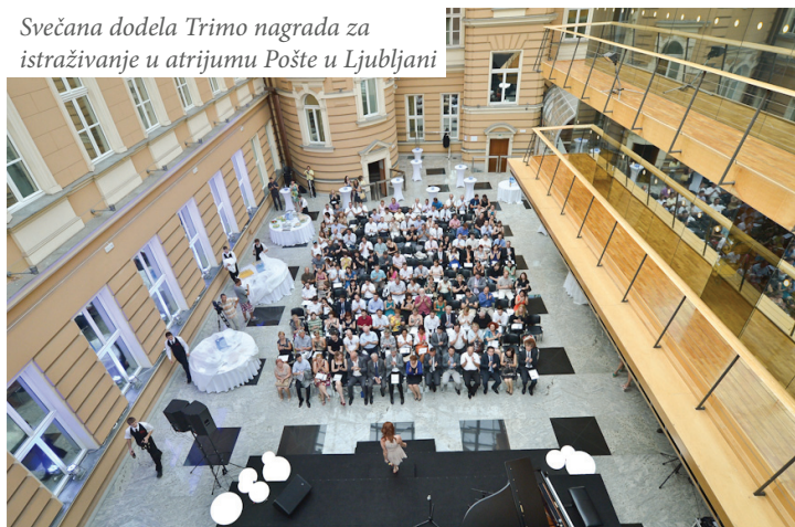
Svečana dodela Trimo nagrada za istraživanje u atrijumu Pošte u Ljubljani

Na dosadašnjim konkursima, učešće je uzelo i 250 mentora nagrađenih radova sa približno 60 fakulteta iz 12 država . Na konkurs mogu da se prijave radovi s područja arhitekture, industrijskog dizajna, građevine, mašinstva, ekonomije i razvoja poslovanja i zaposlenih.