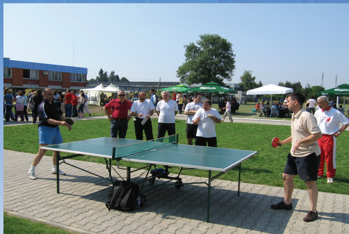
Sportski dan 2012.