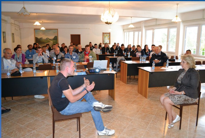
Team Building 2012.