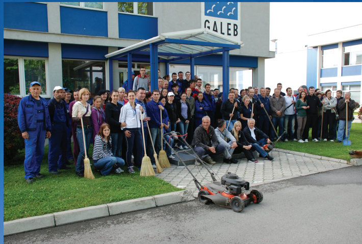
Svetski dan zaštite životne sredine 2013.