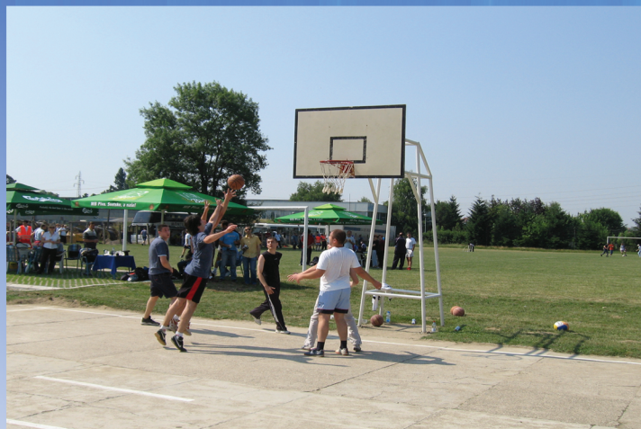
Sportski dan 2011.